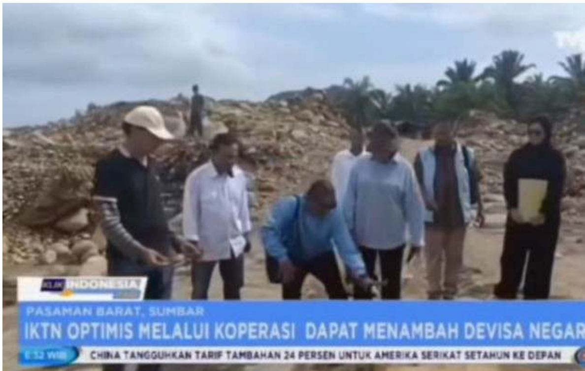
Foto – Foto Tangkapan Layar dari Video Siaran TVRI yang Viral Di INSTAGRAM