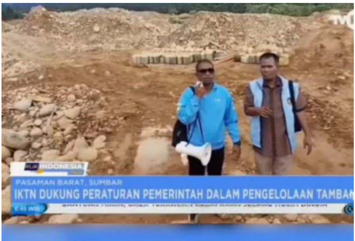
Tangkapan Layar Yang menampilkan Jerigen yang berisi Minyak Solar Bersubsidi