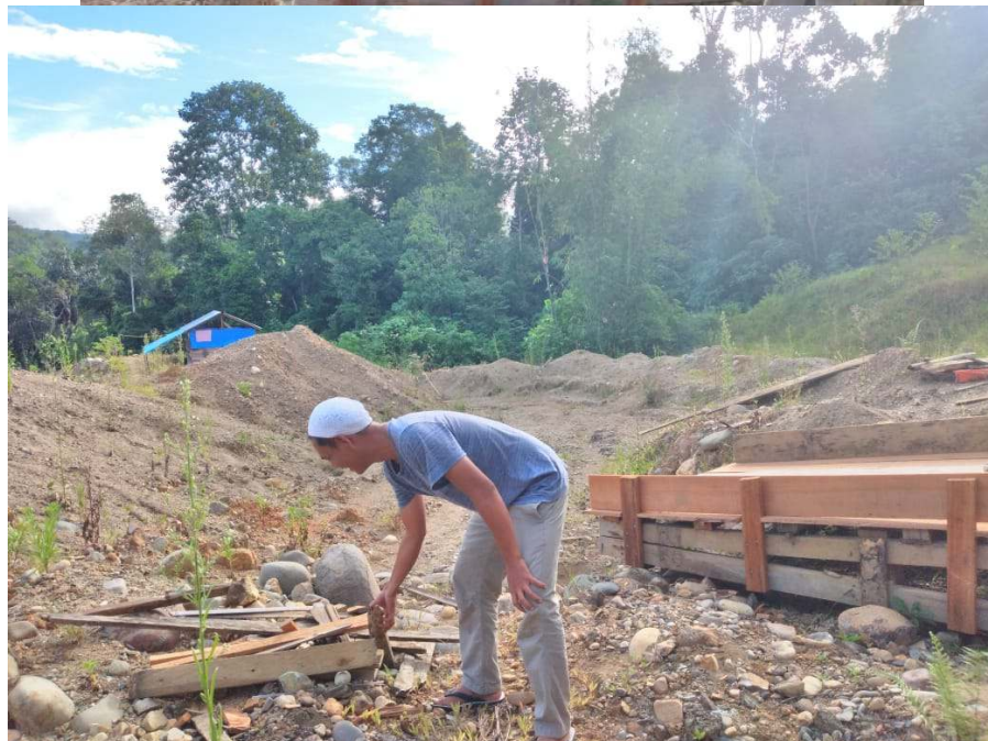
FOTO ORANG dan ALAT (Karpas Penyangkutan Emas) yang pernah di tangkap pada Tahun 2021