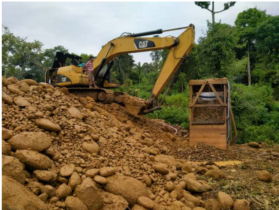
FOTO ORANG dan ALAT BERAT (milik MULYADI) yang pernah di tangkap pada Tahun 2021