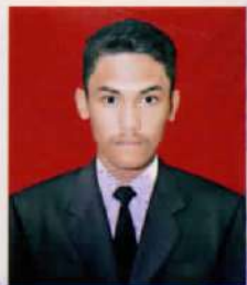
SMK YPWKS CILEGON

dari sekolah menengah kejuruan setelah memenuhi seluruh kriteria sesuai dengan peraturan perundang-undangan.