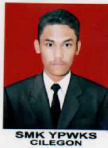
SMK YPWKS CILEGON