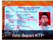
foto depan KTP