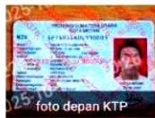
foto depan KTP