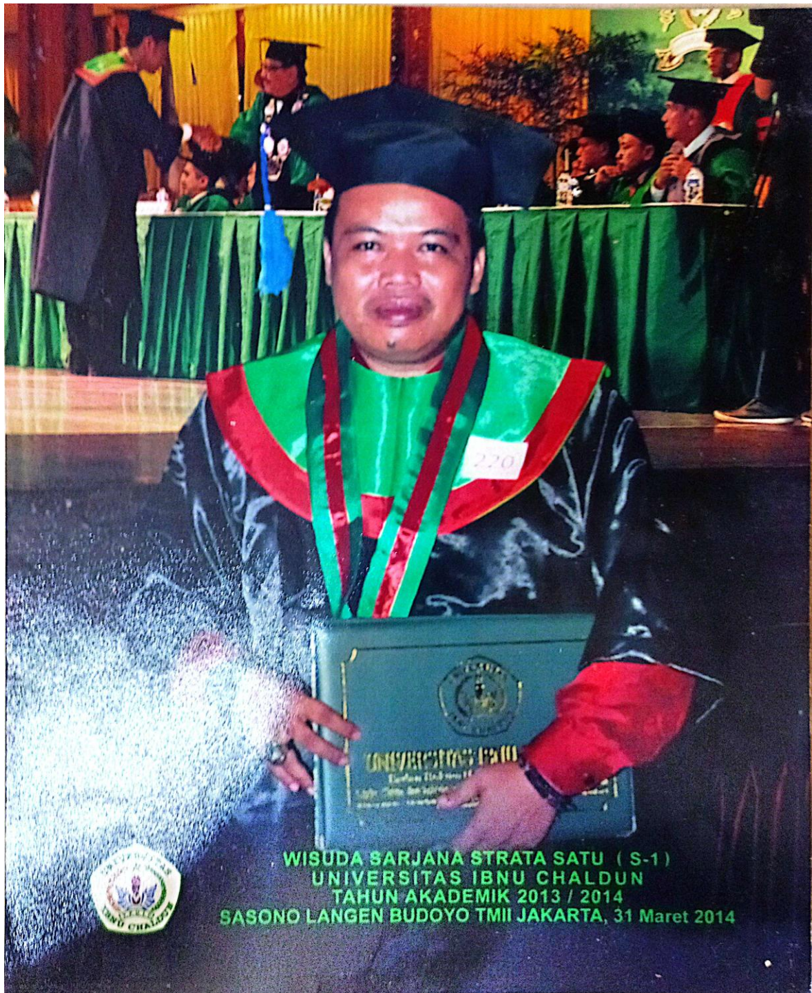
WISUDA SARJANA STRATA SATU ( S-1 ) UNIVERSITAS IBNU CHALDUN TAHUN AKADEMIK 2013 / 2014 SASONO LANGEN BUDOYO TMII JAKARTA, 31 Maret 2014